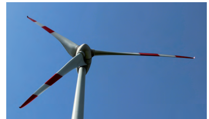
WKA in St. Georgen - Baden Württemberg tut sich aktuell noch schwer in Sachen Windkraft.