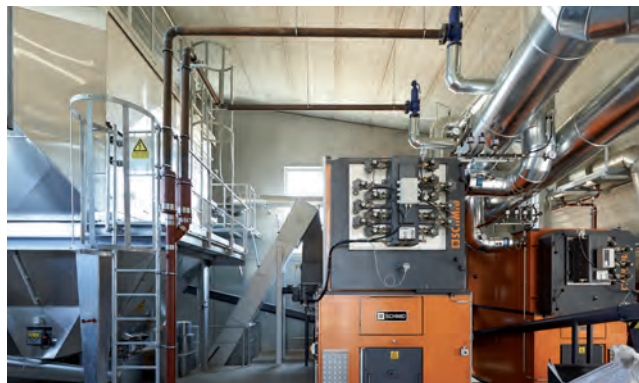
Moderne Holzenergie im Heizhaus - 2 Holzackschnitzel-Kessel mit Elektrofilter im Bioenergiedorf.