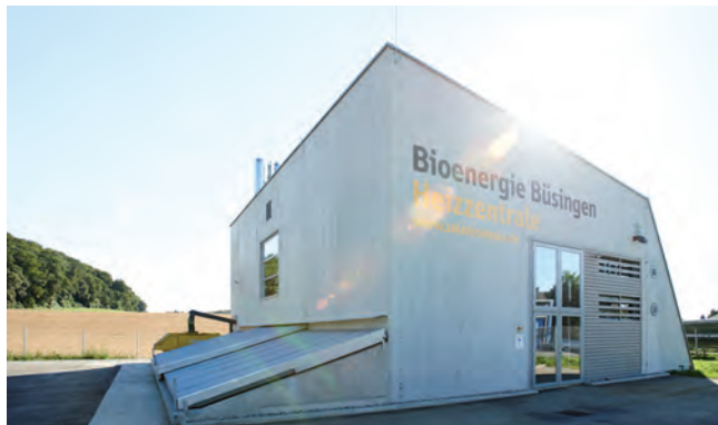
Bioenergie - das 1. Bioenergiedorf mit großer solarthermischer Anlage.

"Der Ausbau und die Nutzung erneuerbarer Energien aus Sonne, Wind, Wasser und Biomasse ist im ländlichen Raum relativ einfach und stellt für diesen eine riesige wirtschaftliche Chance dar. Letztlich werden dort diejenigen regenerativen Energie-Überschüsse produziert werden (müssen) um die großen Ballungsräume mitzuversorgen." Bene Müller